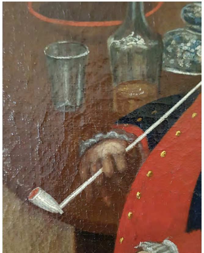
Afb. 10a-b. Koning Frederik Willem I met lange kleipijp, schaal met tabak, wijnfles en glas.