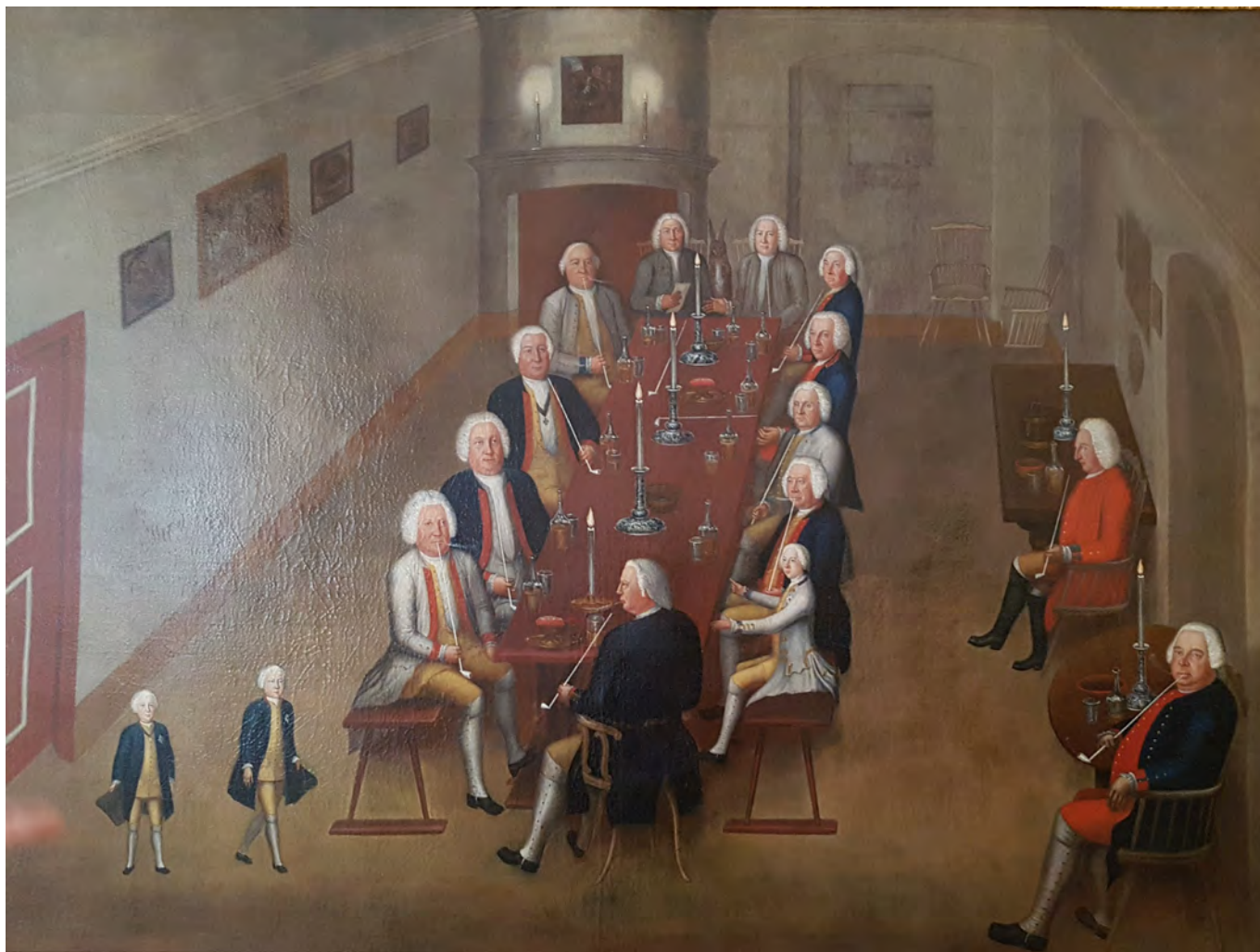
Afb. 7. Tabakscollege van Frederik Willem I. Georg Lisiewski, circa 1737. Collectie Kasteel Königs Wusterhausen (Stiftung Preußische Schlösser und Gärten)

respecteerd als vernederd door de koning. Tussen de raadgevers is een haas geschilderd die waarschijnlijk de vermeende lafheid (Hasenfüßig) van Von Gundling symboliseert of verwijst naar het woord 'Haselanten', in die periode gebruikt om een 'opschepperige nar' aan te duiden. Als de uitspraken van een raad niet klopten, leidde dit nogal eens tot grove grappen van de militairen en soms liepen deze woordwisselingen uit op, door de koning getolereerde, vernederingen en geweld tegen de raadgevers. Het is overigens niet duidelijk of Von Gundling hier daadwerkelijk is afgebeeld want in 1731 was hij al overleden. De overige negen aanwezigen aan de lange tafel zijn waarschijnlijk hooggeplaatste militairen waarmee Frederik Willem I zich graag omringde. Allen hebben een lange kleipijp in de hand of voor zich op tafel liggen en verder een fles en een glas. Voor algemeen gebruik staan op de lange tafel vier kandelaars, twee vuurkomforen en twee schalen waarin de tabak klaar ligt voor gebruik.