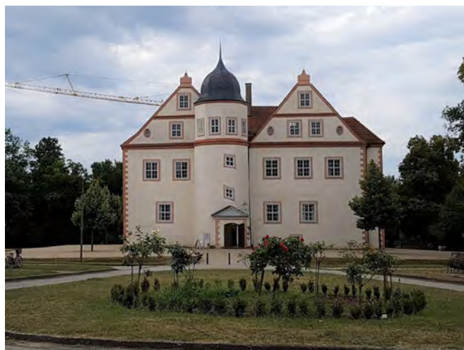
Afb. 1. Kasteel Königs Wusterhausen.

vorst Frederik III. Die schonk het in 1698 aan zijn tien jaar oude zoon, de keurvorst en latere koning Frederik Willem I (1688-1740), die hier de eerste fundamente van zijn hervormingen in bestuur, economie en leger ontwikkelde. Aan het begin van de achttiende eeuw werd Wusterhausen omgedoopt tot Königs Wusterhausen. Het dorp had toen nog geen 250 inwoners.