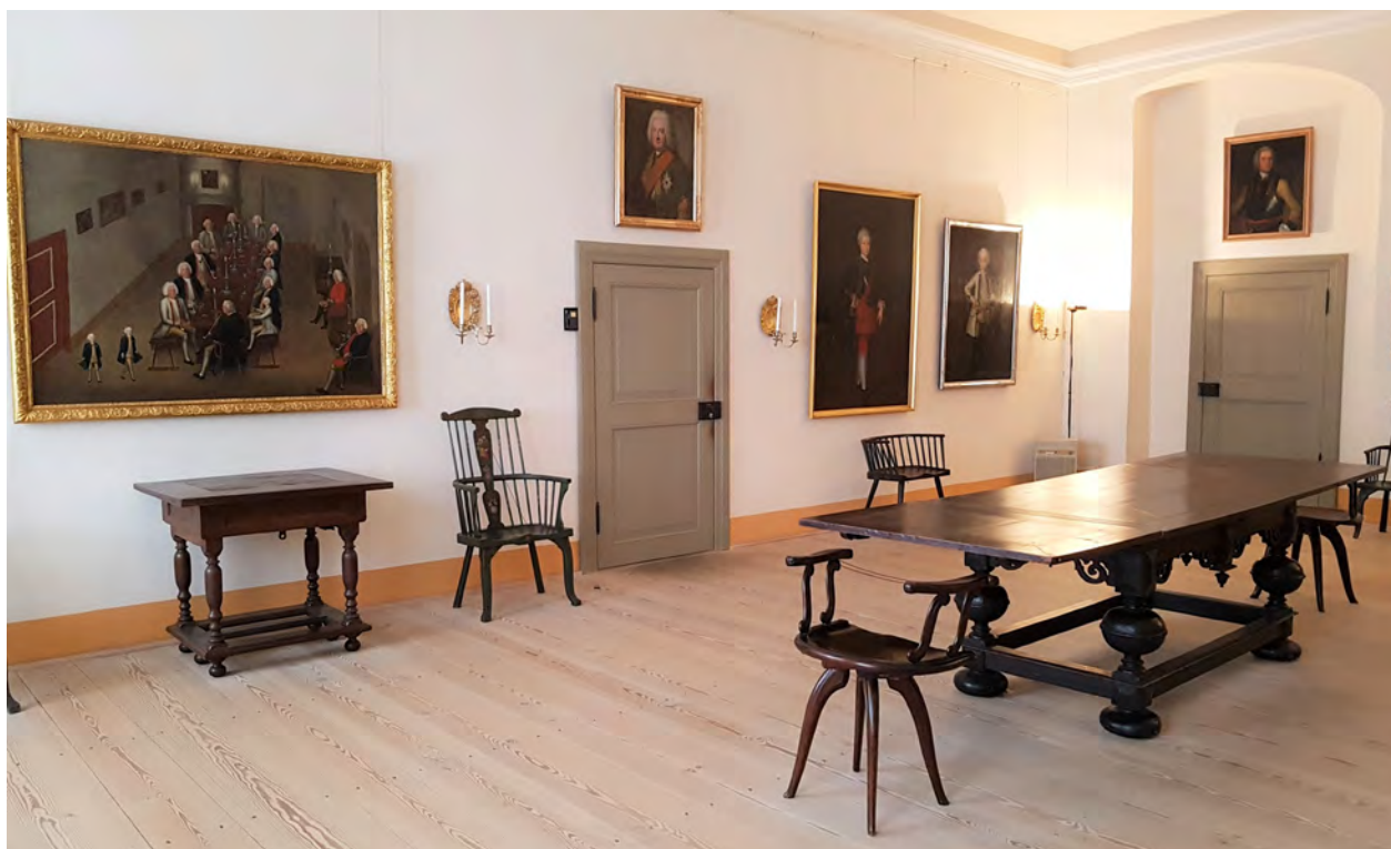
Afb. 6. De kamer in Kasteel Königs Wusterhausen waar het tabakscollege werd gehouden.

Aan de lange eikenhouten tafel zitten naast het kind nog elf volwassenen. Aan het hoofd zitten twee 'grappige raadgevers' waaronder mogelijk Jakob Paul von Gundling (1673-1731), de meest kleurrijke persoon in het Tabakscollege. Deze geleerde werd zowel ge-