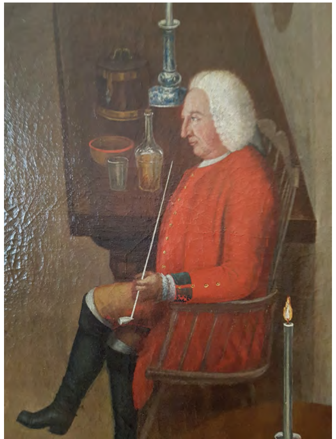
Afb. 9. Man met lange kleipijp, tabakspot(?), schaal tabak, wijnfles en glas.

Na het overlijden van Frederik Willem I in 1740 werd zijn zoon Frederik II of Frederik de Grote (1712-1786) koning in Oost-Pruisen, keurvorst van Brandenburg en