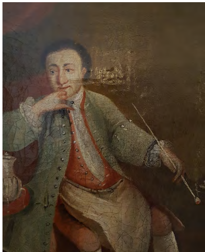
Afb. 13a-b. Jakob Paul von Gundling (detail). Onbekende schilder.