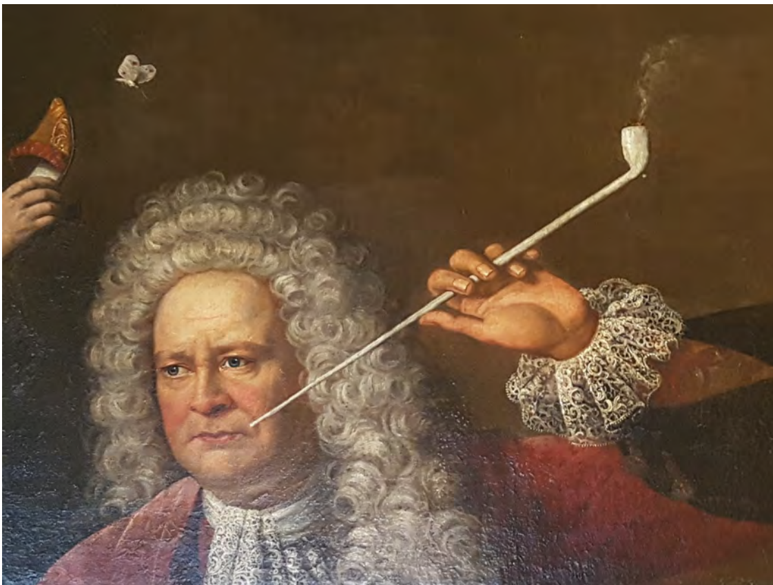
Afb. 12. Jakob Paul von Gundling met lange kleipijp, circa 1725 (detail). Onbekende schilder.

Al voor het midden van de achttiende eeuw was de afzet van de Nederlandse pijpenmakers verminderd. Niet alleen omdat in Duitsland en het tegenwoordige Polen steeds betere pijpen werden gemaakt, maar ook door de verarming die in Europa optrad. Werkloosheid, stijgende prijzen en lager reële lonen waren van invloed op het koopgedrag van de consument en ook de Goudse pijp kreeg het zwaar te verduren en werd in het buitenland steeds meer een luxe product. Daarnaast werd ook het kwaliteitsverschil tussen de buitenlandse pijpen en die van Gouda steeds kleiner waardoor men vaker koos voor goedkopere lokaal vervaardigde pijpen. 11 Al in 1742, twee jaar na het overlijden van zijn vader, trof Frederik II mercantilistische voorbereidingen ter bescherming van de eigen Pruisische pijpenindustrie die later zouden uitmonden in invoerverboden. Frederik II heeft daardoor een enorme invloed gehad op de export van Goudse pijpen. 12