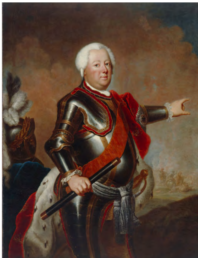
Afb. 2. Frederik Willem I. Antoine Pesne, na 1733. Deutsches Historisches Museum.

De stad ligt circa 35 kilometer ten zuiden van Berlijn. Wusterhausen kwam in 1683 in het bezit van de keur-