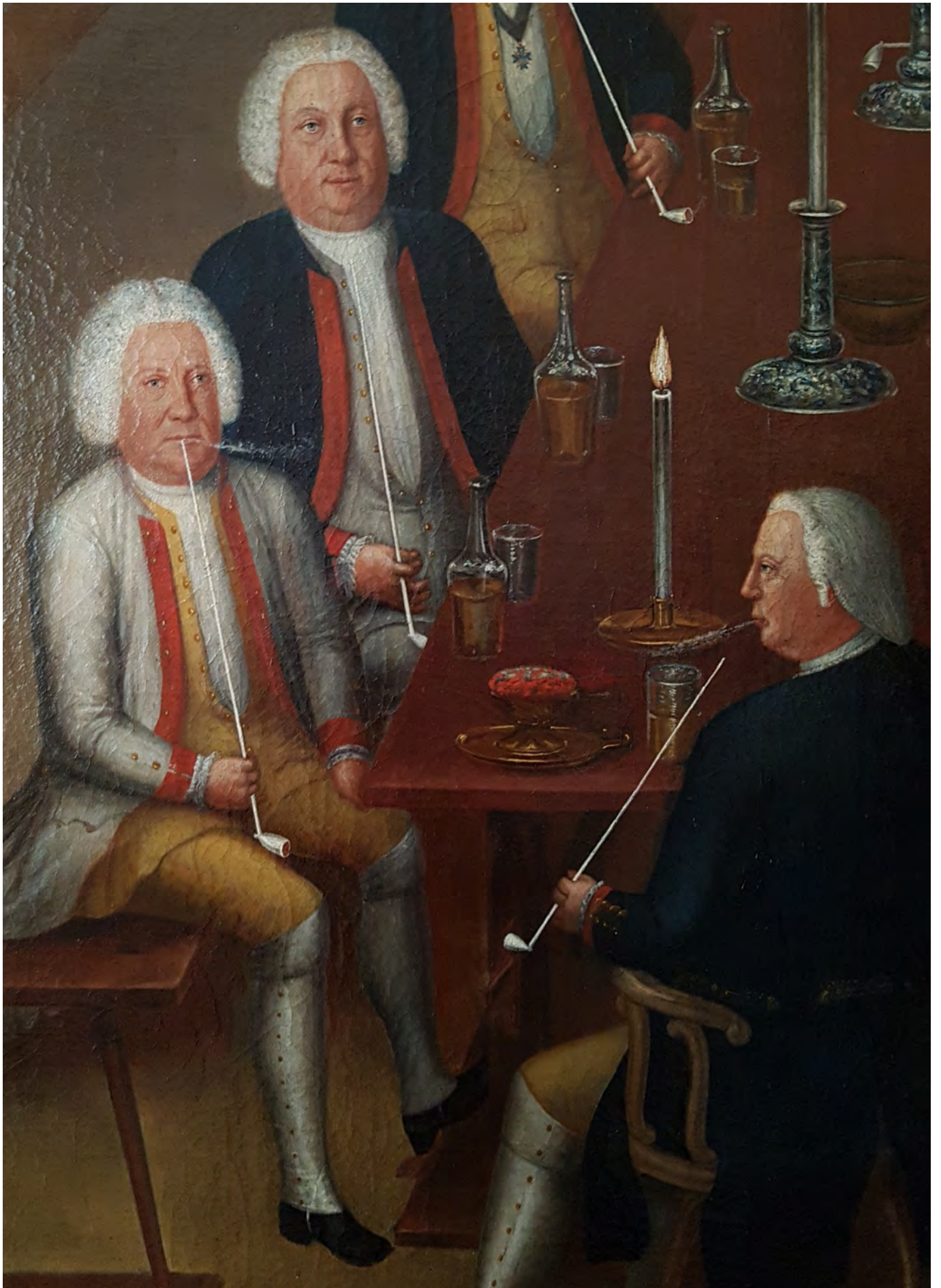
Afb. 8. Drie aanwezigen met kleipijpen en vuurkomfoor.