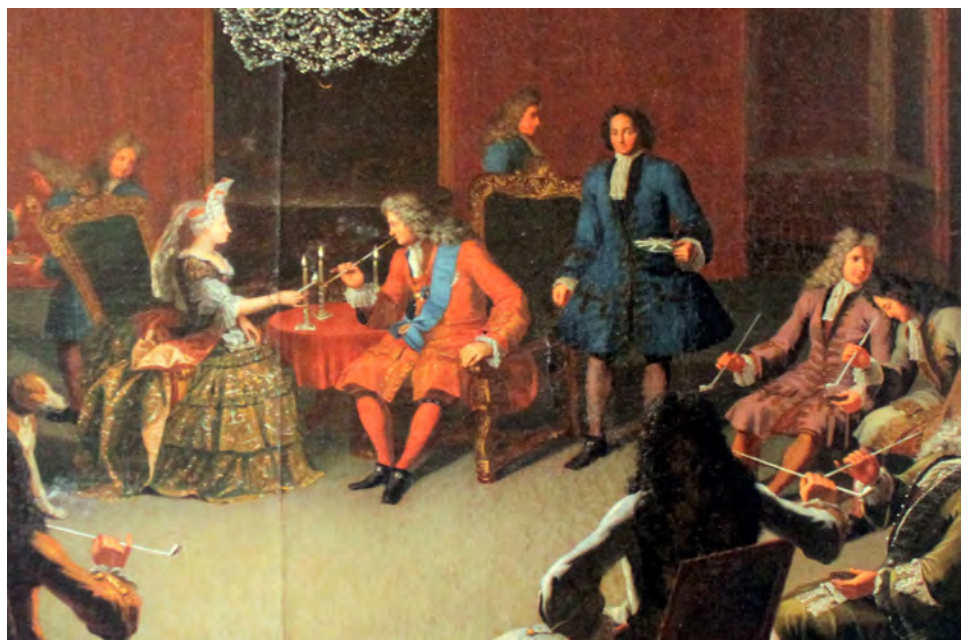
Afb. 5. Tabakscollege van Frederik I (detail) in de Rode Kamer van het Berlijnse Stadsslot. Paul Carl Leygebe, circa 1710.

De benaming ‘Tabakscollege’ werd indertijd gebruikt om een groep mensen aan te duiden, meestal mannen met eenzelfde achtergrond, die zich regelmatig verzamelden voor tabaksgenot en gezelligheid. Historisch gezien werd het Tabakscollege gewoonlijk geassocieerd met de gelijknamige bijeenkomsten onder koning Frederik Willem I, maar ook tijdens het koningschap van zijn vader Frederik I (1657-1713) werd al een Tabakscollege gehouden ‘in Meinung, dass der Gebrauch des Tabaks gegen alle böse Luft gut sei’. Aan deze bijeenkomsten namen ook vrouwen deel. Op een schilderij uit circa 1710 (afb. 5) zien we het Tabakscollege van