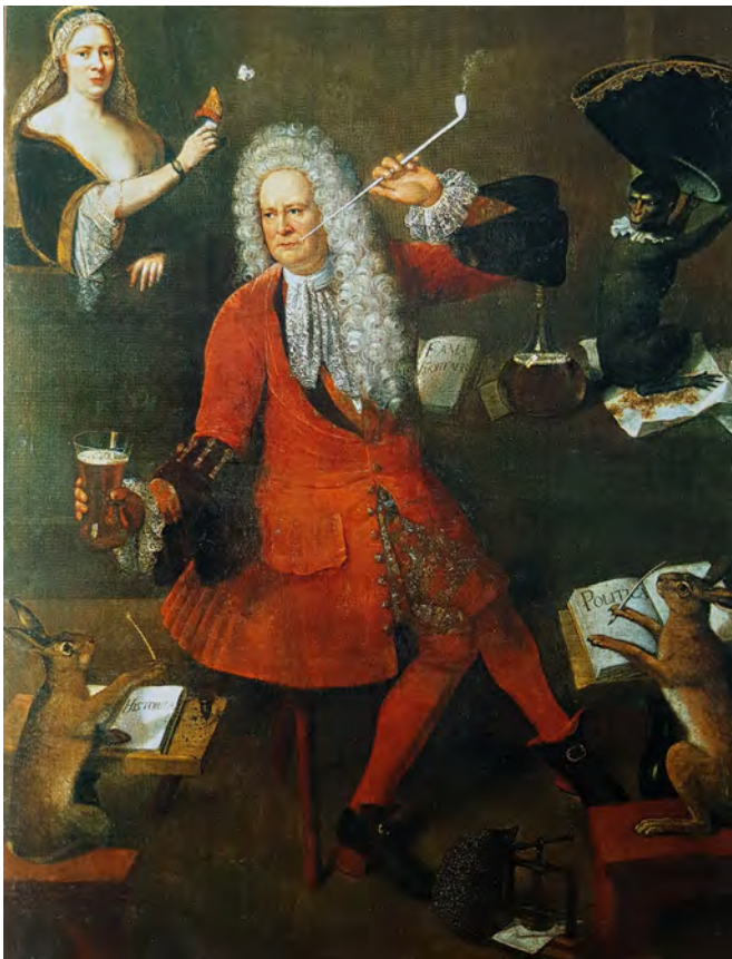
Afb. 11. Jakob Paul von Gundling met zijn vrouw, een aap, egel en twee hazen, circa 1725. Onbekende schilder. Collectie Kasteel Königs Wusterhausen (Stiftung Preußische Schlösser und Gärten)

vanaf 1772 koning van geheel Pruisen. Onder Frederik II werd het Tabakscollege aan het Pruisische hof beëindigd. Hij had een afkeer van het roken van tabak en gaf de voorkeur aan snuiftabak. Dit was ook de periode waarin de Duitse adel en de hogere kringen overstapten op het gebruik van snuif, dat beter paste bij de verfijnde en galante levenssfeer van de Rococo. Dit zal zeker van invloed zijn geweest op de export van de kwaliteitspijpen uit Gouda die deels werden vervangen door ivoeren snuifraspen en verfijnde snuifdozen. 10