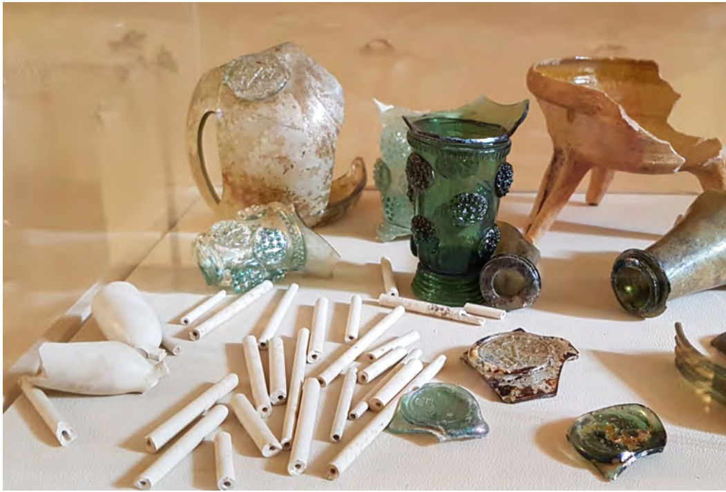
Afb. 3. Enkele bodemvondsten van Kasteel Königs Wusterhausen.

menten. Desondanks is het interessant rookgerei omdat we nu vrijwel zeker weten welke pijpen tijdens het Tabakscollege van Frederik Willem I werden gerookt en uit welke Goudse werkplaats die afkomstig waren. Uit toekomstige opgravingen op het kasteelterrein zal moeten blijken of de koning of zijn dienaren ook rookgerei van andere Goudse pijpenmakers gebruikten. Als Frederik Willem I, evenals vele tijdgenoten, trouw aan één merk is geweest zal hij het alleen bij producten uit de werkplaats van Danens hebben gehouden waardoor hij verzekerd was van de allerbeste kwaliteit.